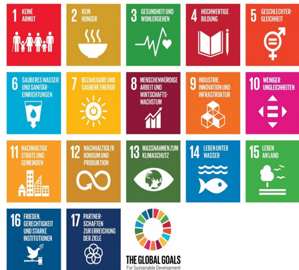
Grafik: Vereinte Nationen

In der neuen Gesamtschule geht man/frau jeden Tag an den Nachhaltigkeitszielen der UN vorbei, die auf jeder Tür kleben.